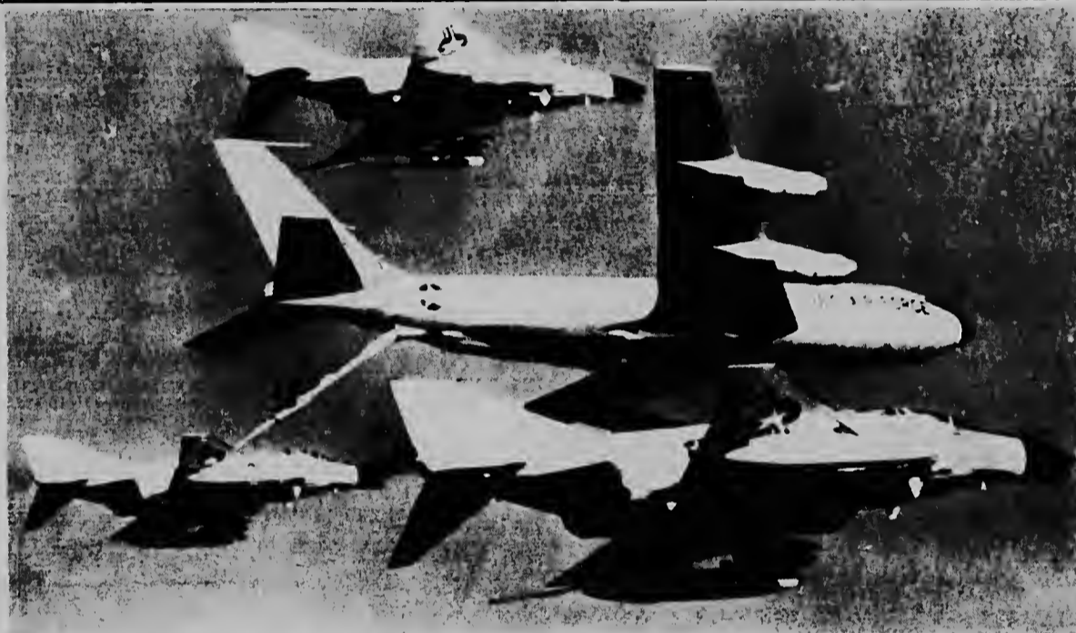
Riba e foto aki nos por mira un avion caza jet "Phantom" ta tuma combustible for di un avion tanquero KC-135 Strato-tanker durante un vuelo riba Viet Nam. Dos otro Phantom, fuertemente armá y yen di cohete bao di nan ala, ta wardando riba nan colega pa caba y asina nan tambe haña combustible. E Phantom por alcanza un velocidad di 1600 milla pa ora y tur ta ser usá contra e guerrilleronan Viet Cong.

E impresion ta cu e suspension di e bombardeonan na Vietnam del Norte lo continua mas alla di e termino di e tregua di Aña Nobo Lunar, Vietnam cu lo caba diadomingo.